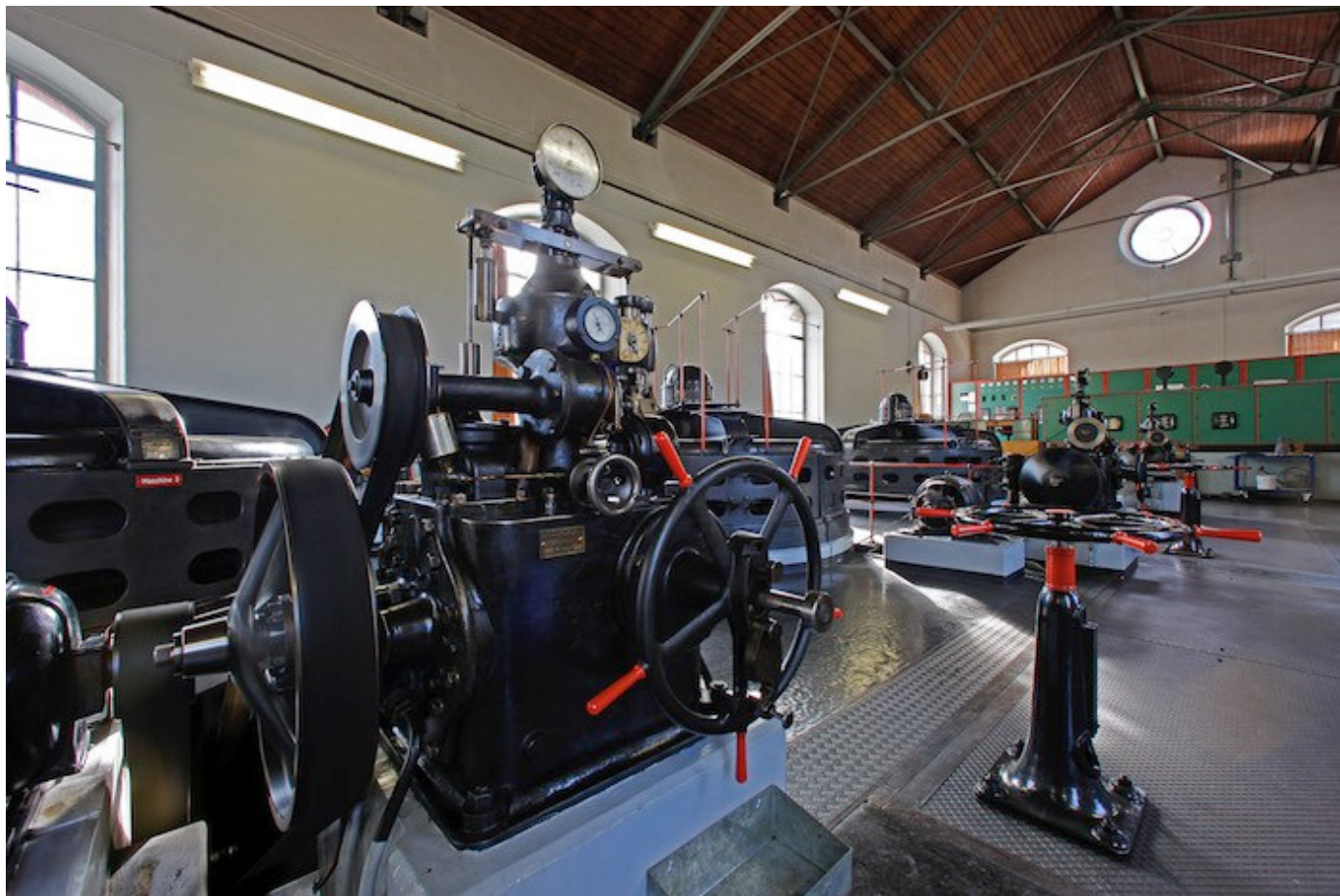
Die Technik in der Maschinenhalle des Elektrizitätswerks Interlaken soll bis Ende Dezember ausgebaut werden.

Zusammenhang mit dem Bau des Schifffahrtskanals vom Bahnhof Interlaken West zum Thunersee. Zu dieser Zeit boomte der Tourismus in der Region und verlangte nach mehr Komfort – unter anderem in Form von elektrischem Licht. Im Jahr 1924, 24 Jahre nach dem Bau des Kraftwerks, wurden die ersten Maschinen ersetzt. Ihre Nachfolgerinnen verrichteten ihren Dienst schliesslich bis in die heutige Zeit.